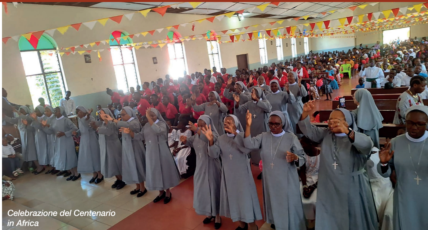
Celebrazione del Centenario in Africa